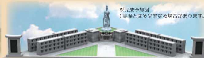
永代供養墓 白い蓮