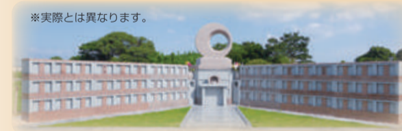
永代供養墓 紫い水